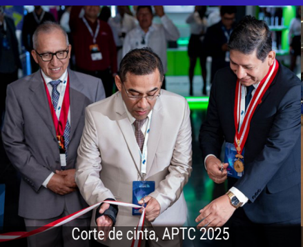
Corte de cinta, APTC 2025

En la última jornada, el eje pasa por la sostenibilidad del crecimiento y la transformación del modelo de los ISPs. Se abordan temas como la integración de redes, el rol complementario de la conectividad satelital y la evolución hacia plataformas de servicios más amplias. En ese escenario, la automatización, la eficiencia operativa y la seguridad se posicionan como factores determinantes para competir en un mercado donde la conectividad, cada vez más, tiende a convertirse en commodity.